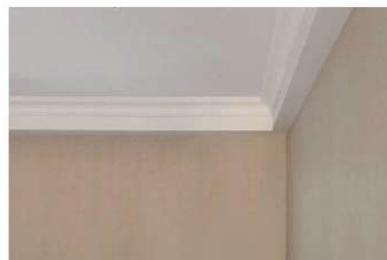
Tapéta és mennyezeti spray vakolatok mintája

Beltéri permetező robotokat alkalmaztak a Fengtong Gardenben, a Yangjiang Smart Home-ban, a Yiyang Dongcheng Capital-ban, a Lechang Country Gardenben, a Chaozhou Smart Bathroom Apartment-ban és más projekteknél, és sikeresen teljesítették az a megrendelő fél, a fővállalkozó és a felügyelet minőségi kritériumait. Az egyes projektek összesített permetezési területe meghaladja a 200 000 m 2 -t.