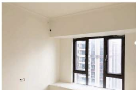
Azonos színű festék hatásraja a falon és a mennyezeten